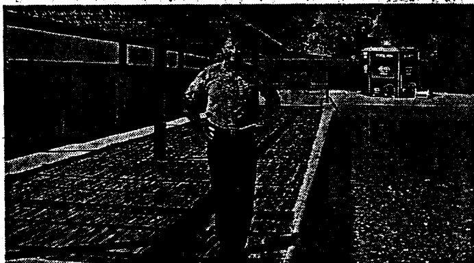
Il sindaco Giancarlo Cossu a bordo piscina

CHIARAMONTI. Da mercoledì 11 luglio e per tutto il mese di agosto i chiaramontesi avranno una nuova arma contro l'afa e la noia dei lunghi pomeriggi estivi. Ristrutturata e dotata di un nuovo gazebo di copertura in legno di bambù, dopo circa un anno di interruzione, riapre al pubblico la piscina «Onda blu» nel centro sportivo polivalente di «Paris de cunventu», sul monte Carmelo.